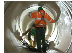
Sanierungs- und Abdichtungssysteme für Rohrleitungen